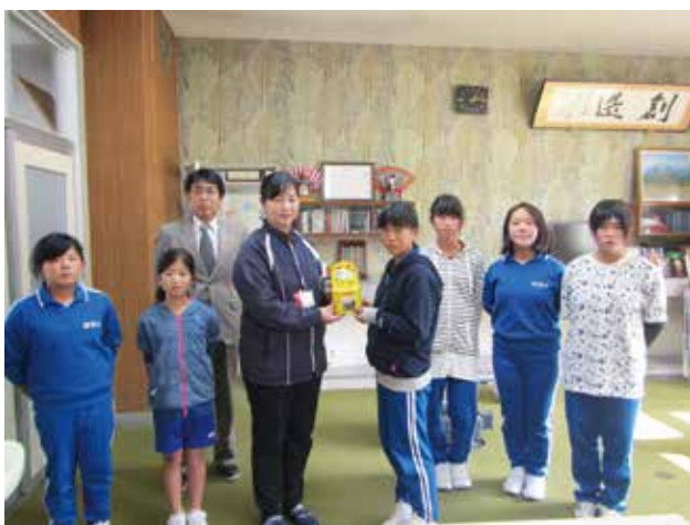
10/27 昭和小学校代表委員会の皆さん