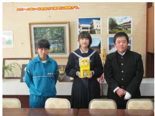
11/8 昭和中学校生徒会の皆さん