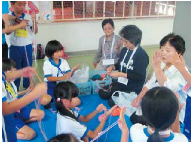
9/6 昔遊び (杉の子会)