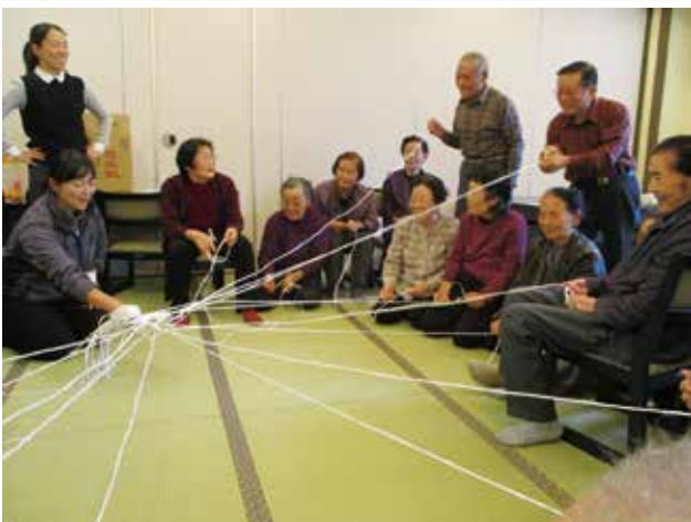
10/31 ゆへいり倶楽部 (民児協)