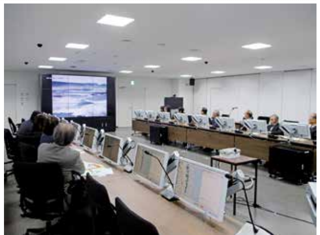
11/9 福島県危機管理センター視察 (民児協他)