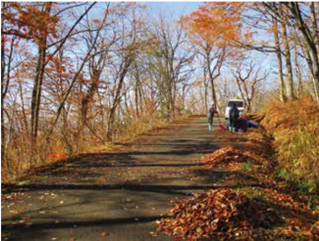
11/13 落ち葉拾い (よつばの会)