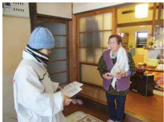
声かけ訪問活動 (ゆきだるマン 様)