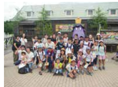
子ども夏休み交流事業