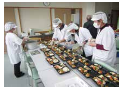
さくら様の調理風景