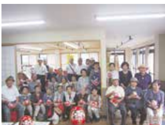
一人暮らし高齢者親睦旅行