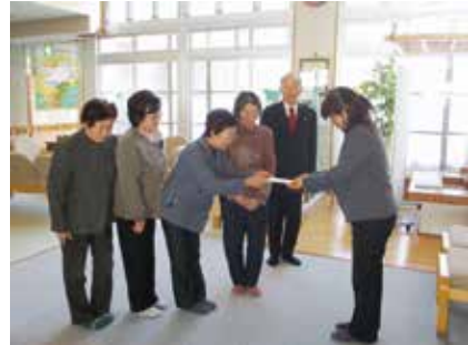
老人クラブ連合会様