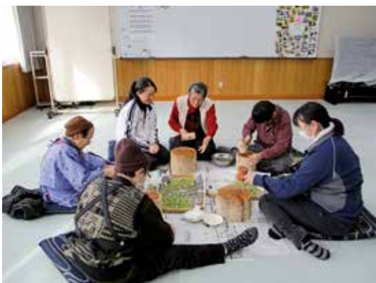
打ち豆づくり (よつばの会 様)