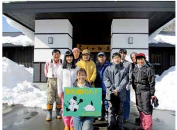
今年で20年目となる除雪ボランティア活動 (NPO 法人ハートネットふくしま 様)