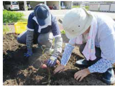
地域生活活動支援