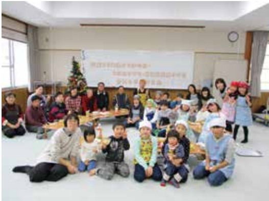
合同クリスマス会 (放課後児童クラブ 様・つみきクラブ 様・よつばの会 様)