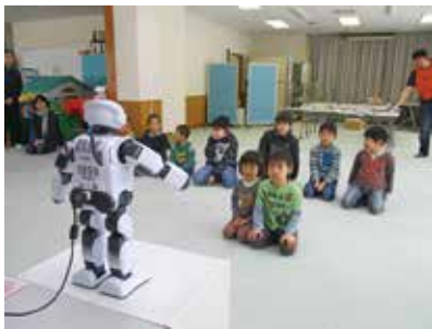
ロボット体験inしょうわ

おひとりでも悩まずにお気軽にご相談ください。これからのことを、あなたと一緒に考えます。