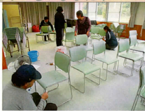
10/11 すみれ荘環境整備 (よつばの会様)