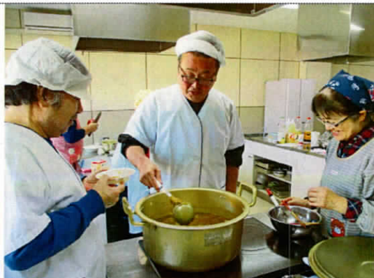
11/12 収穫祭 (よつばの会様)