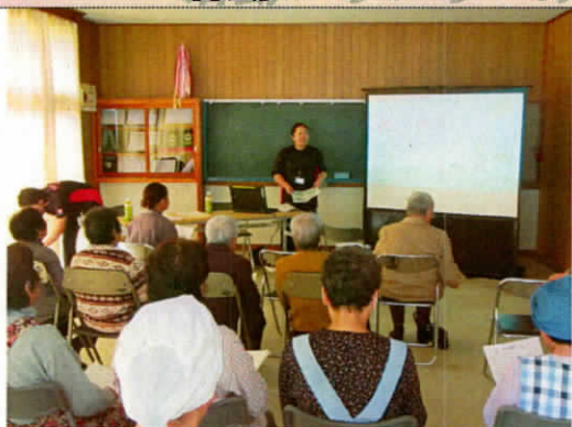
10/5 サロンきさらぎ (大芦きさらぎ会様)