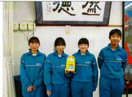
11/5 赤い羽根学校募金協力 (昭和中学校生徒会様)

社会福祉協議会に対するご意見・ご要望をお待ちしております。お気軽にお寄せください。 発行：社会福祉法人昭和村社会福祉協議会 〒968-0104 福島県大沼郡昭和村大字小中津川字石仏 1836 番地 電話：0241-57-2655 / FAX：0241-57-2649 / URL： http://showa-shakyo.or.jp / E-mail： showa-shakyo@helen.ocn.ne.jp