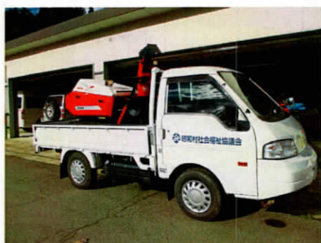
除雪機械貸出事業

また、利用契約の手続きは、利用したいその日にできるとは限りません。期日に余裕をもってご準備いただきますようお願いいたします。