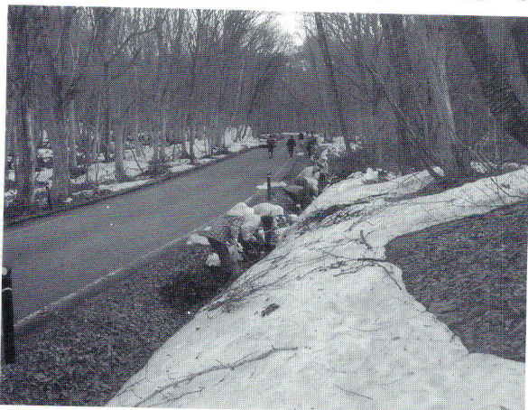
4/29 博士とう ⑨清掃活動(赤十字奉仕団)