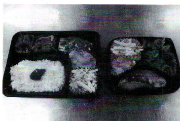
ごはん「あり」と「なし」を選択できます！