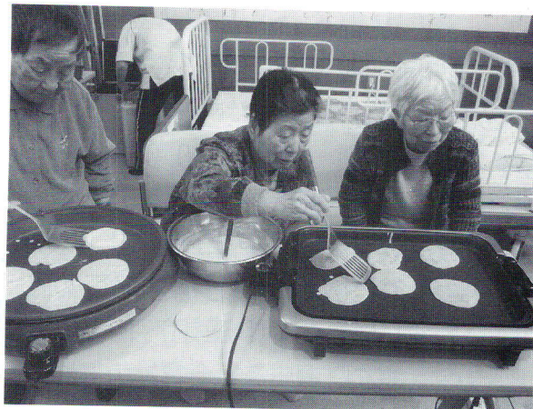
5/7 端午の節句おやつ作り(デイサービス)