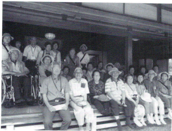
7/10 一人暮らし高齢者親睦旅行(新潟市)