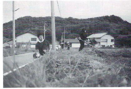
刈払機による草刈り