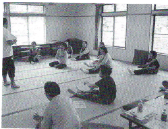
7/2 ふれあい交流事業(老人クラブ連合会)