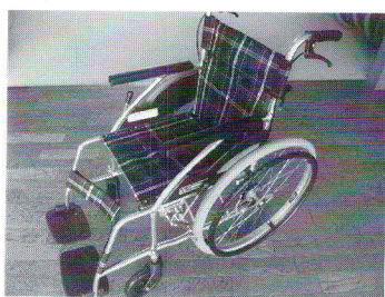
プルタブ 9 号の配備完了！