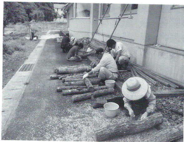
6/8 しいたけ植菌(よつばの会)