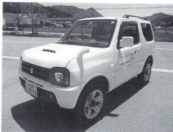
地域福祉活動広報車整備事業(共同募金助成事業)