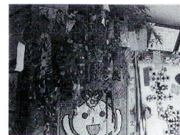
デイサービスセンターの七夕飾り

＝社会福祉協議会に対するご意見・ご要望をお待ちしております。お気軽にお寄せください。＝