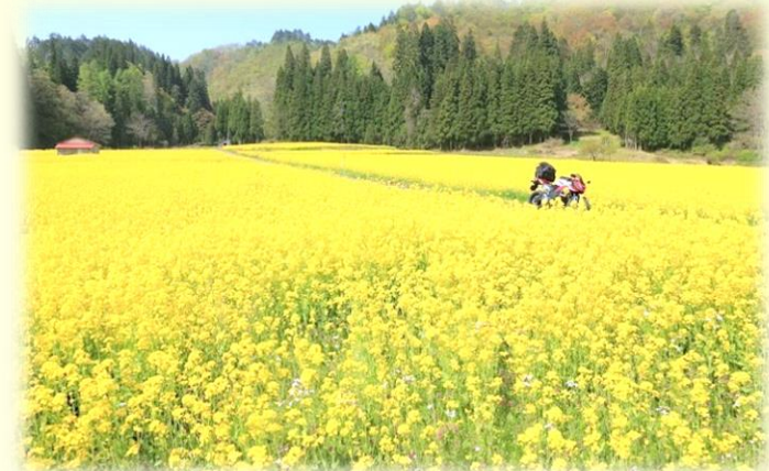
今はもう見られない野尻地区の菜の花畑ですがYoutubeで偲ぶ事ができます https://youtu.be/S71PhWLYius (H27年5月撮影分)