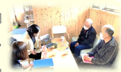
SC協議体はこんな感じでやっています 2021.12.9. 於:ちゃランドリー井戸端

野尻地区には、地区の全住民を会員とする『ゆいクラブ』があります。「地区と自分たちの暮らしを守る」ため、防災や景観整備など幅広く活動しています。「議員時代は『村全体』の事を考えてきたが『集落』が良くならなければ村は良くない。」「自分たちの集落を良くするために最大限の努力をしなければと思った。」と、力強い仲間たちや“野尻営農生産組合”と共に、荒れ果てた土地の開墾が始まりました。国の「耕作放棄地撲滅」の政策とも合致し、機器燃料費や肥料代などの補助も受け、数年後4ヘクタールの荒地は写真のように美しい菜の花畑に生まれ変わりました。遠方から多くの方が訪れ、昭和村の観光名所にもなりました。