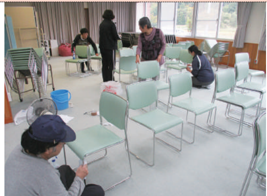
10/11 すみれ荘環境整備 (よつばの会様)