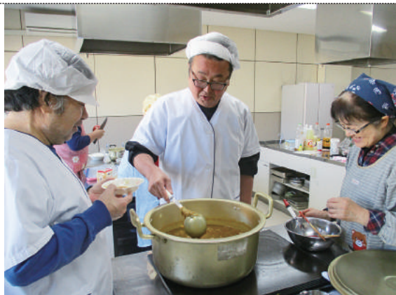
11/12 収穫祭 (よつばの会様)