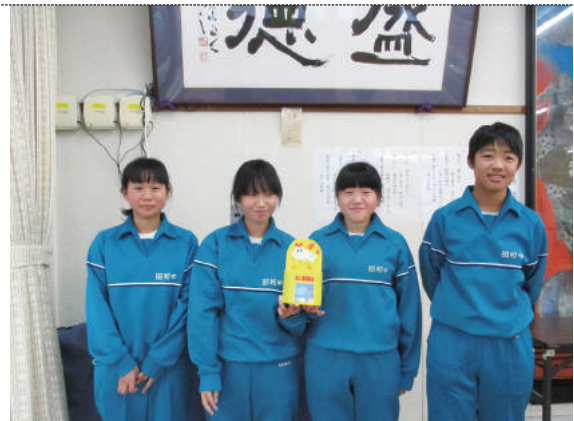
11/5 赤い羽根学校募金協力 (昭和中学校生徒会様)

社会福祉協議会に対するご意見・ご要望をお待ちしております。お気軽にお寄せください。