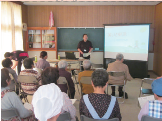
10/5 サロンきさらぎ (大芦きさらぎ会様)