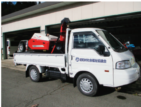
除雪機械貸出事業

また、利用契約の手続きは、利用したいその日にできるとは限りません。期日に余裕をもってご準備いただきますようお願いいたします。