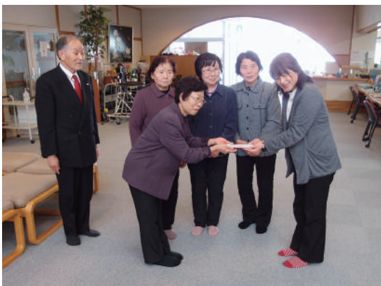
友愛訪問活動 (昭和村老人クラブ連合会 様)