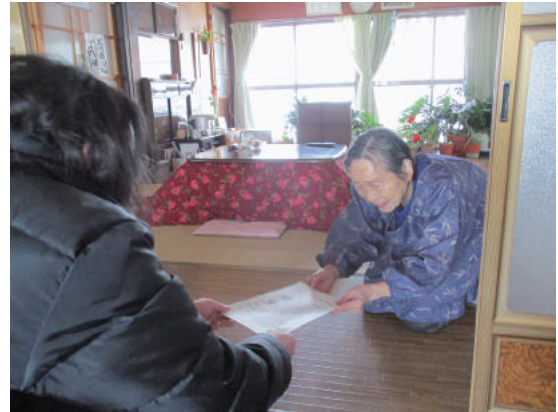
声かけ訪問活動 (ゆきだるマ☺ 様)