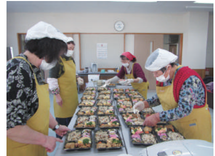
ハピネス 様の調理風景