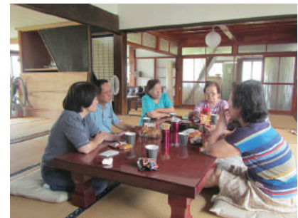
集いの場形成事業