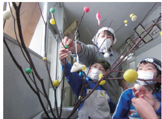
団子さし (杉の子会 様)