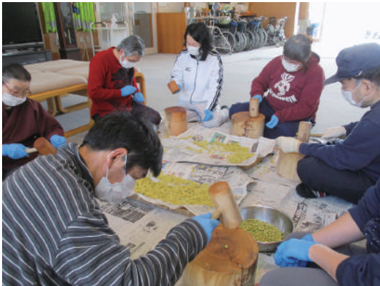
打ち豆づくり (よつばの会 様)