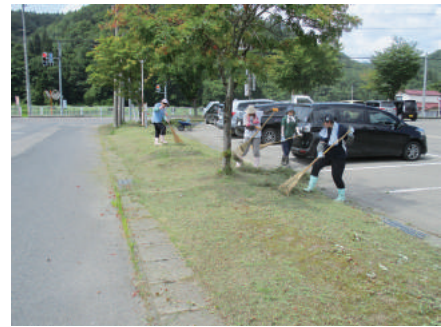
地域生活活動支援