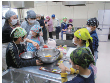
児童健全育成活動