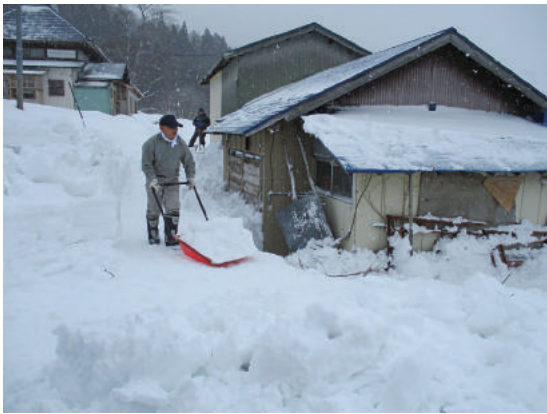
除雪ボラ☺ティア活動 (NPO 法人ハートネットふくしま様)