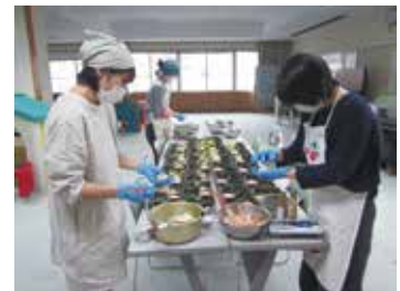
カチコチ友の会様の調理風景