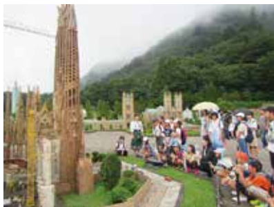
児童の健全育成支援