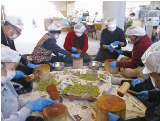
12/23 打ち豆づくり (よつばの会 様)