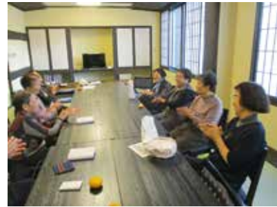
集いの場形成支援