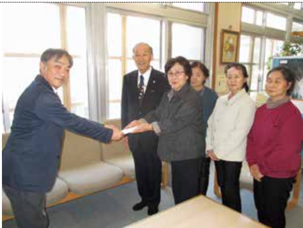
2/4 友愛訪問活動 (老人クラブ連合会 様)