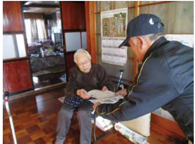
1/12 声かけ訪問活動 (ゆきだるマン 様)