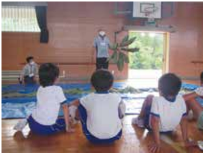
9/2 小学校自然体験学習(杉の子会 様)