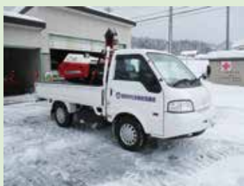
除雪機械貸出事業(事前予約制です!)

一度手続きをしていただきますと、契約者や料金支払いの口座情報等に変更がない限り、その後の手続きは必要ありません。期日に余裕をもってご準備いただきますようお願いいたします。