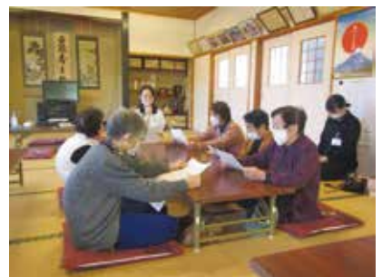
11/13 お達者くらぶ(中向地区の皆様)