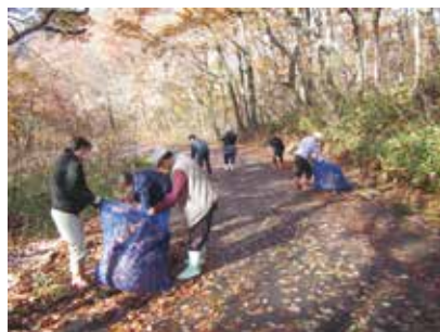
11/12 落ち葉拾い(よつばの会 様)