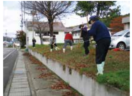
10/29 すみれ荘環境整備(よつばの会 様)