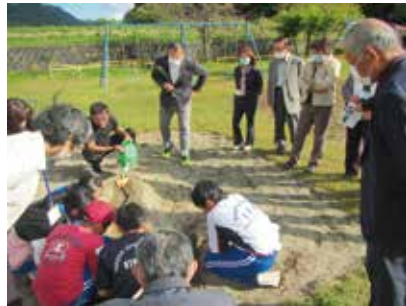
10/6 小学校訪問(民生児童委員協議会 様)