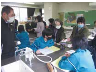
11/4 中学校訪問(民生児童委員協議会 様)