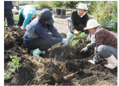
(よつばの会「ヤーコン収穫」)