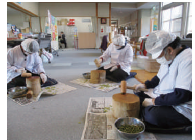
(よつばの会「打ち豆づくり」)