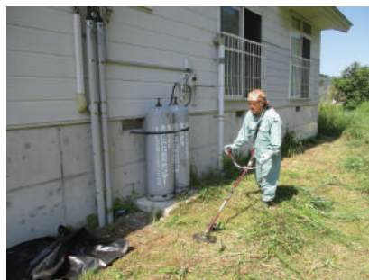
空き地の除草作業