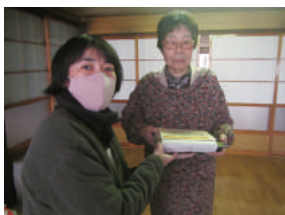
歳末お楽しみ弁当宅配事業