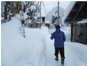
(ゆきだるマン「声かけ訪問」)