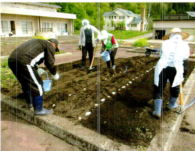
じゃがいも種植え付け (よつばの会)