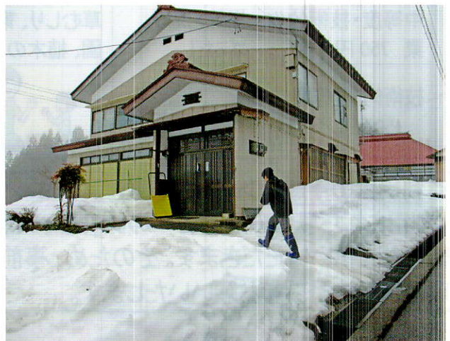
冬期間声かけ訪問活動 (ゆきだるマン)