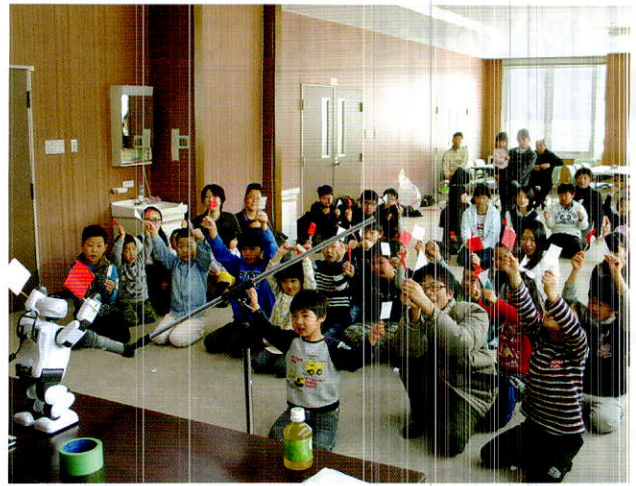
コミュニケーションロボット「パルロ」と@交流 (NPO法人IT工房ひのき様・富士ソフト様)