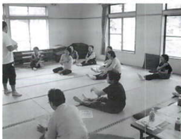
7/2 ふれあい交流事業(老人クラブ連合会)