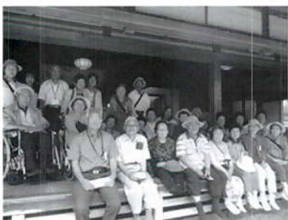
7/10 一人暮らし高齢者親睦旅行(新潟市)