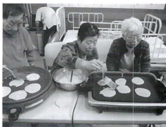
5/7 端午の節句おやつ作り(デイサービス)