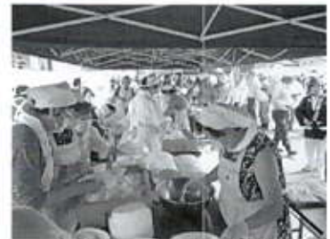
赤十字奉仕団炊き出し訓練