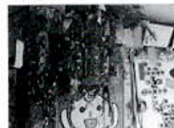
デイサービスセンターの七夕飾り

＝社会福祉協議会に対するご意見・ご要望をお待ちしております。お気軽にお寄せ◎ください。＝