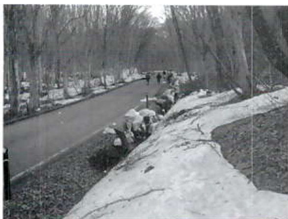
4/29 博士とう ①清掃活動(赤十字奉仕団)