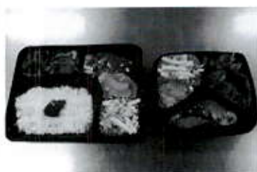
ごはん「あり」と「なし」を選択できます!

7月3日(金)の夕食弁当は、デイサービスの調理員さんに調理してもらいました。(下写真)。おいしいお弁当、ありがとうございました。