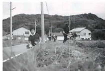
刈払機による草刈り