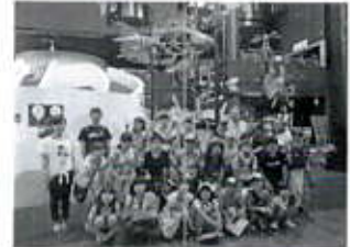
子ども夏休み交流事業