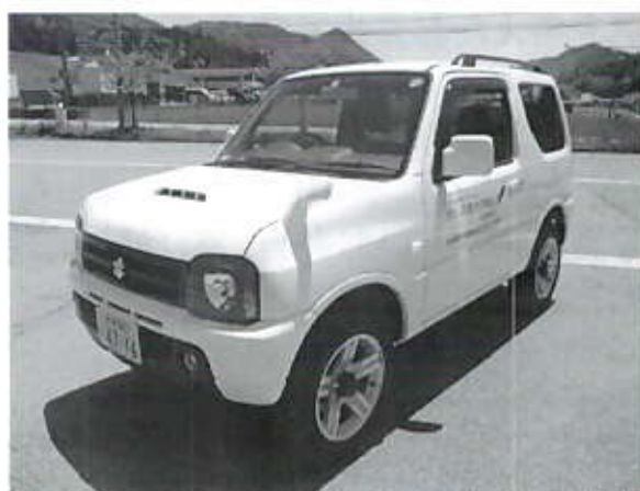
地域福祉活動広報車整備事業(共同募金助成事業)