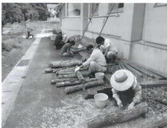
6/8 しいたけ植菌(よつぱの会)