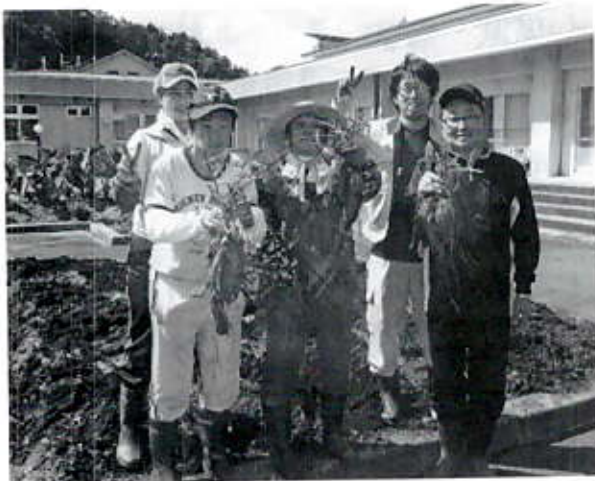
10/5 サツマイモの収穫 (よつばの会様)