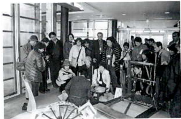
11/22 第24回全国ボランティアフェスティバルふくしま分科会(昭和村・金山町)