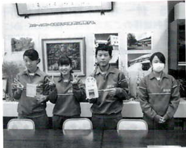
11/11 赤い羽根募金 (昭和中生徒会様)