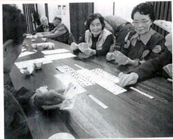
11/17 ゆへいり倶楽部 (民児協様)