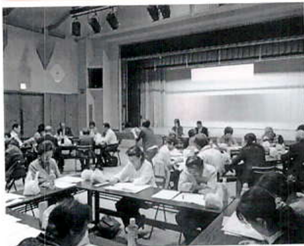
9/18 3町村合同研修会 (民児協様)