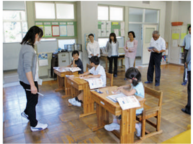
6/10 小学校訪問 (右)・7/11 中学校訪問 (左) [民児協]