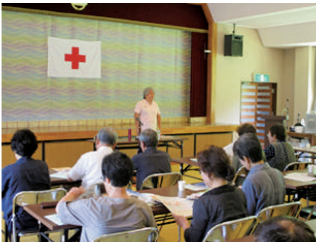
7/1 両沼方部赤十字奉仕団連絡協議会総会 [赤十字奉仕団]