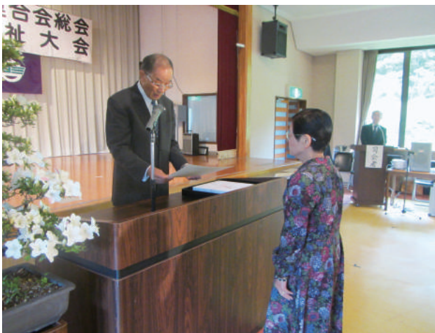
6/1 総会・老人福祉大会 [老人クラブ連合会]