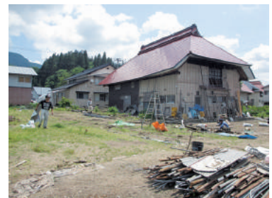
家屋周辺の片づけ