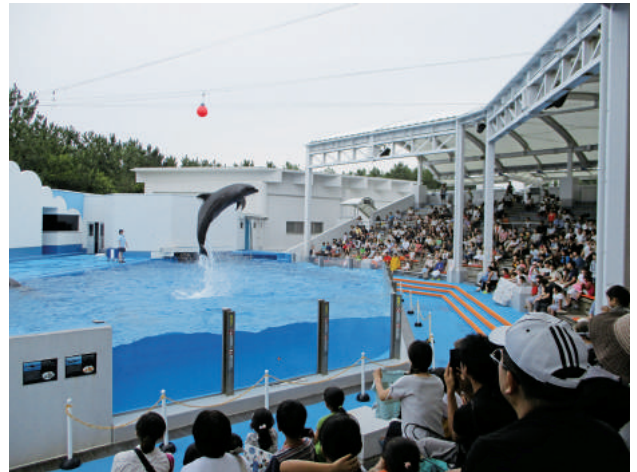
7/26 子ども夏休み交流事業 (新潟マリニピア水族館)

※ [左写真] 酒井優樹くん (中1) は会場の見学者を代表して、イルカさんと握手したよ!