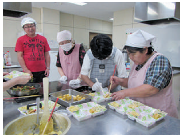
7/11 調理実習 [よつばの会]