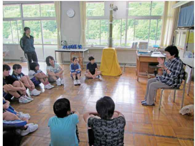
6/8 小学校訪問 [杉の子会]