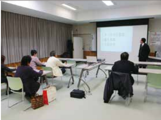
11/9 法律講座 (福島県司法書士会様)