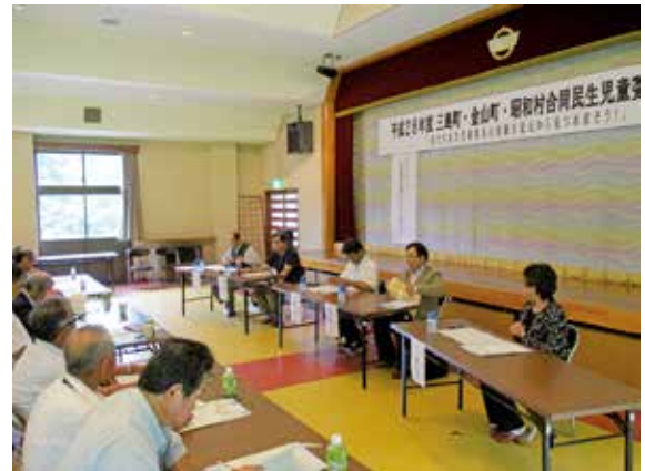
9/13 平成28年度三島町・金山町・昭和村民生児童委員合同研修会（しらかば会館）