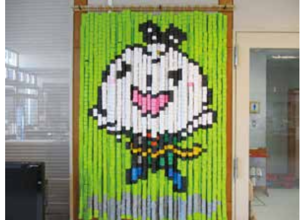
からむん壁掛け完成 (よつばの会)