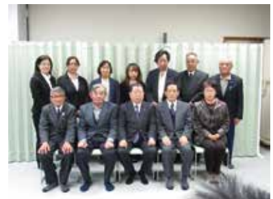
(村長さんを囲んで！)

長い間お疲れ様でした。今後とも住民福祉の向上にご理解とご協力をお願いいたします。