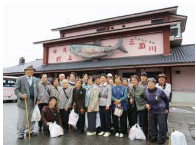
10/18 高齢者親睦旅行 (新潟県村上市)