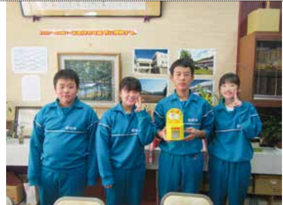
11/7 募金活動 (昭和中学校様)