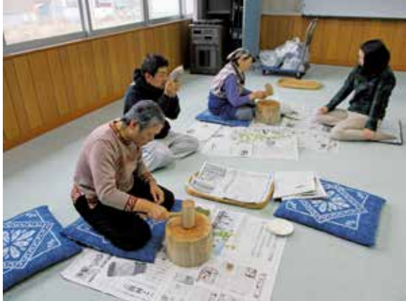
11/28 打ち豆作り (よつばの会)