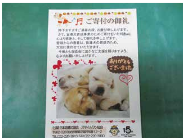
書き損じはがきに対するお礼の葉書