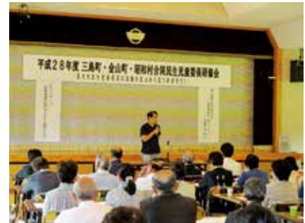
三島町・金山町・昭和村合同民生児童委員研修会（昭和村会場）