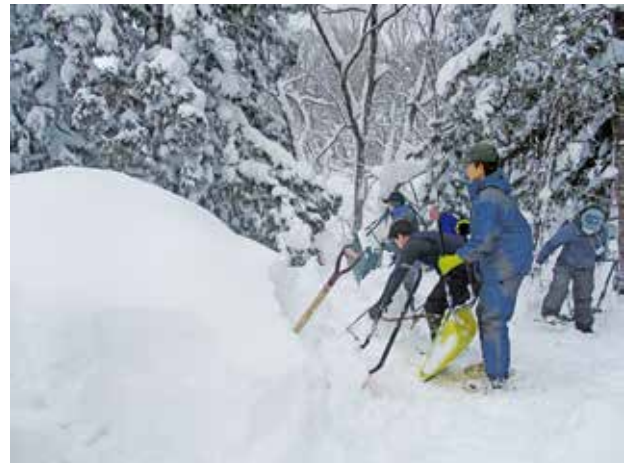
除雪ボランティア活動（ハートネットふくしま様）