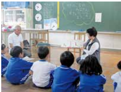
児童健全育成活動

おひとりでも悩まずにお気軽にご相談ください。これからのことを、あなたと一緒に考えます。