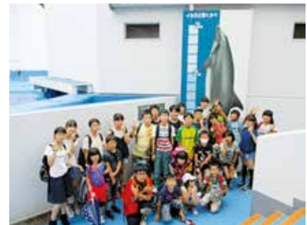
子ども夏休み交流事業