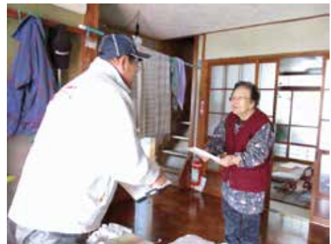
声かけ訪問活動 (ゆきだるマン様)