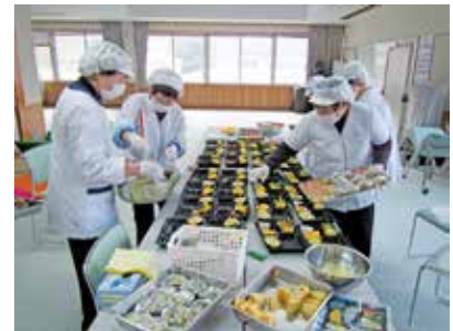
ハピネス様の調理風景