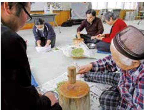
打ち豆づくり&凍み大根づくり (よつばの会様)