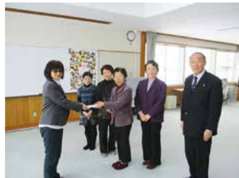
老人クラブ連合会 様