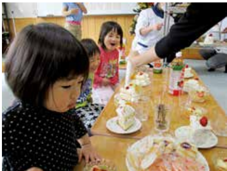
合同クリスマス会 (つみきクラブ様)