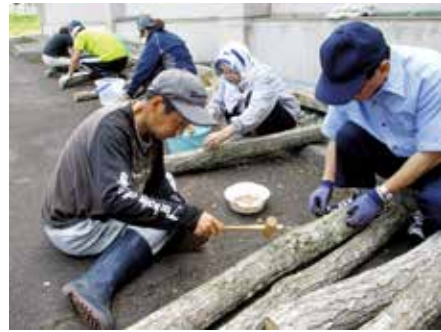
地域生活活動支援