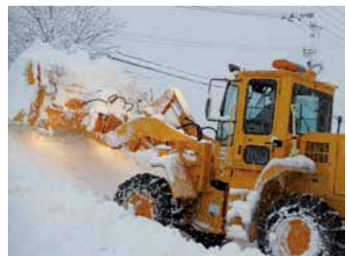
公道や公共施設の除雪作業

(※) よつばの会は、昭和村に在住の障がいを持った方々の地域生活を支援する会で、週 2 回、主にすみれ荘で様々な活動を行っています。