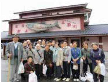
一人暮らし高齢者親睦旅行